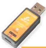
USB2SYS-Interface (Artikelnummer BXA76007)

Der Li-Polar LS 3.2 (Artikelnummer LPAA300008) darf nur mit Originalzubehör betrieben werden. Neben der kostenlos erhältlichen PC-Anwendung sind folgende Optionen lieferbar: